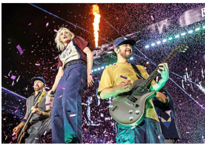
Heute in der Arena: die Nu-Metal-Helden von Linkin Park.

Jetzt wird's laut – und jetzt wird's eng. Im Juni geben gleich mehrere Weltstars Konzerte in der Allianz Arena. Das wird auch Stress in der U-Bahn bedeuten. Los