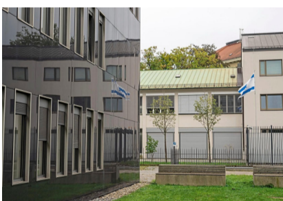
Das israelische Generalkonsulat in der Barerstraße.

Es waren Schock-Szenen vor dem israelischen Generalkonsulat: Ein 24-Jähriger hatte am 7. März mehrere Faustgroße Steine gegen die Fassade des israelischen Generalkonsulats geworfen. Dann