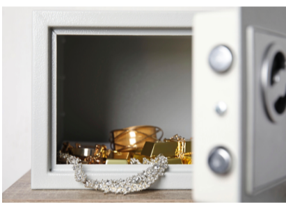
Der Tresor der Seniorin war prall gefüllt.

Eine über 80-jährige Truderergerin hat es Trickbetrügern leicht gemacht. Die Seniorin glaubte nicht nur deren Geschichte, sondern ließ die Männer auch in ihr Haus. Die Kriminellen brachten sie sogar da-